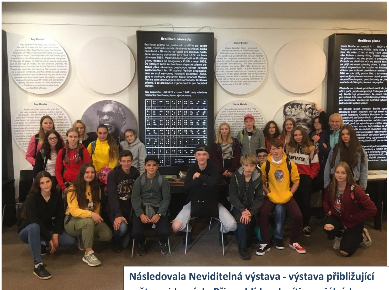
Následovala Neviditelná výstava - výstava přibližující svět nevidomých. Při prohlídce devíti speciálních zatemněných místností, simulace interiéru a exteriéru, jsme se řídili pouze hmatem, sluchem a čichem za asistence nevidomého průvodce.